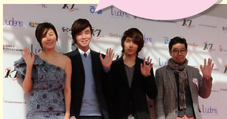
“きみはペット”監督 キム・ピョンゴン

私たち“きみはペット”チームは、美しく希望に溢れた茨城を映像に映し、韓国と日本、アジアを越え、世界に茨城の健在さを知らせることが出来るように、誠心誠意を尽くします。頑張ってください!