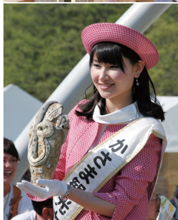
笠間の陶炎祭(～5月5日まで)