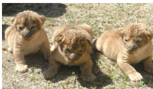
震災後の3月16日に生まれた3頭のライオンの子ちゃん

4月10日までは、地震の影響でストレスを受けている小さなお子さんたちを元気づけるために、動物園とレジャーランドの無料開放を実施しました。新緑のかみね公園で、動物と触れ合い、遊園地で楽しい時間を過ごされてはいかがでしょうか。