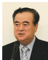
茨城県知事 橋本 昌

復興に向けて 東日本大震災の発生から、約1ヵ月半が過ぎました。 今なお、県内各地でも、被災者の方々は懸命に生活再建に取り組みおられ、本格的な回復にはしばらく時間がかかるものと認識しております。 その一方、道路・鉄道・水道・電気などライフラインは、着実に復旧が進み、復興への手応えが感じられてきております。 このような中、被災地の一つである笠間市では、震災に見舞われた方々を元気づけようとさまざまな困難を乗り越えて、今年も恒例の「陶炎祭」が開催されております。 今後とも、一日も早い復興を願う皆さまの熱い想いを真摯に受け止め、被災者の支援策や農林水産物の風評被害対策などに取り組むとともに、茨城の再生に向けて一層の努力をしてまいります。