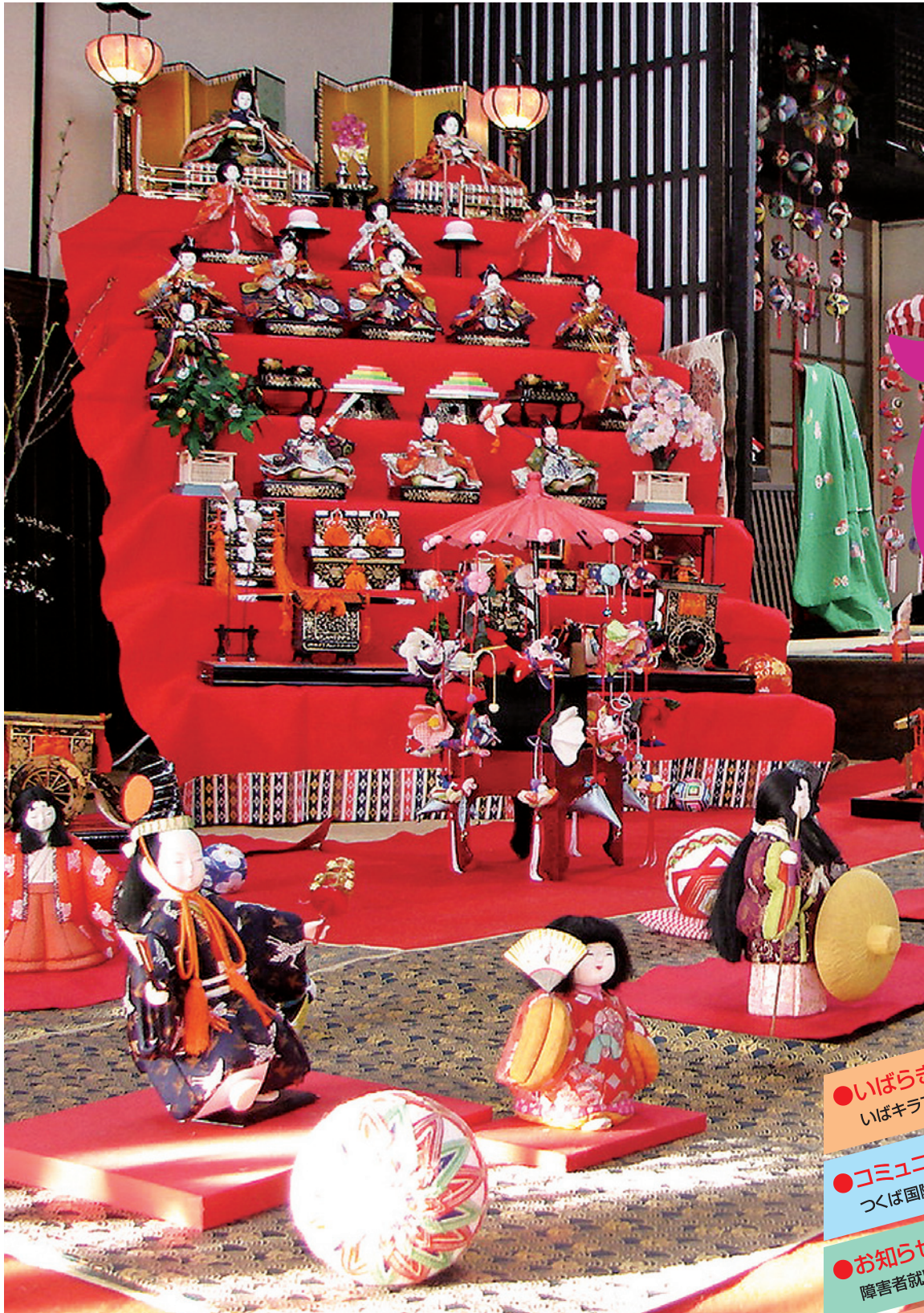
真壁のひなまつり(2月4日～3月3日、桜川市) 桜川市商工観光課 ☎0296(55)1159