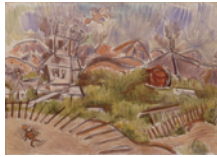
萬 鐵五郎「地震の印象」1924年