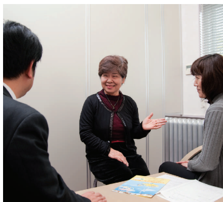
新しい出会いをコーディネート

いばらき出会いサポートセンターは、結婚を希望する独身男女に出会いの機会を提供するために、平成十八年に設立されました。水戸市の県三の丸庁舎に本部が、日立市・鹿嶋市・牛久市・結城市に地区センター