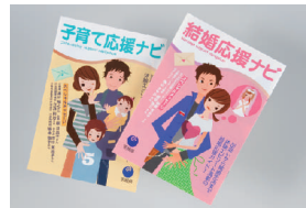
結婚・子育て応援ナビ 検索

があります。同センターでは会員制のパートナー紹介（登録料三年間有効一万円）や、ふれあいパーティーの開催などを行っており、二十人の相談員が、会員の婚活をサポートしています。会員数は約二千八百人（平成二十二年四月末現在）であり、これまで四百五十一組（会員以外との結婚を含む）が成婚しました。