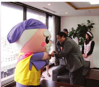
名刺交換もできるようになりました