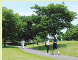
木陰もたくさんあるコースです