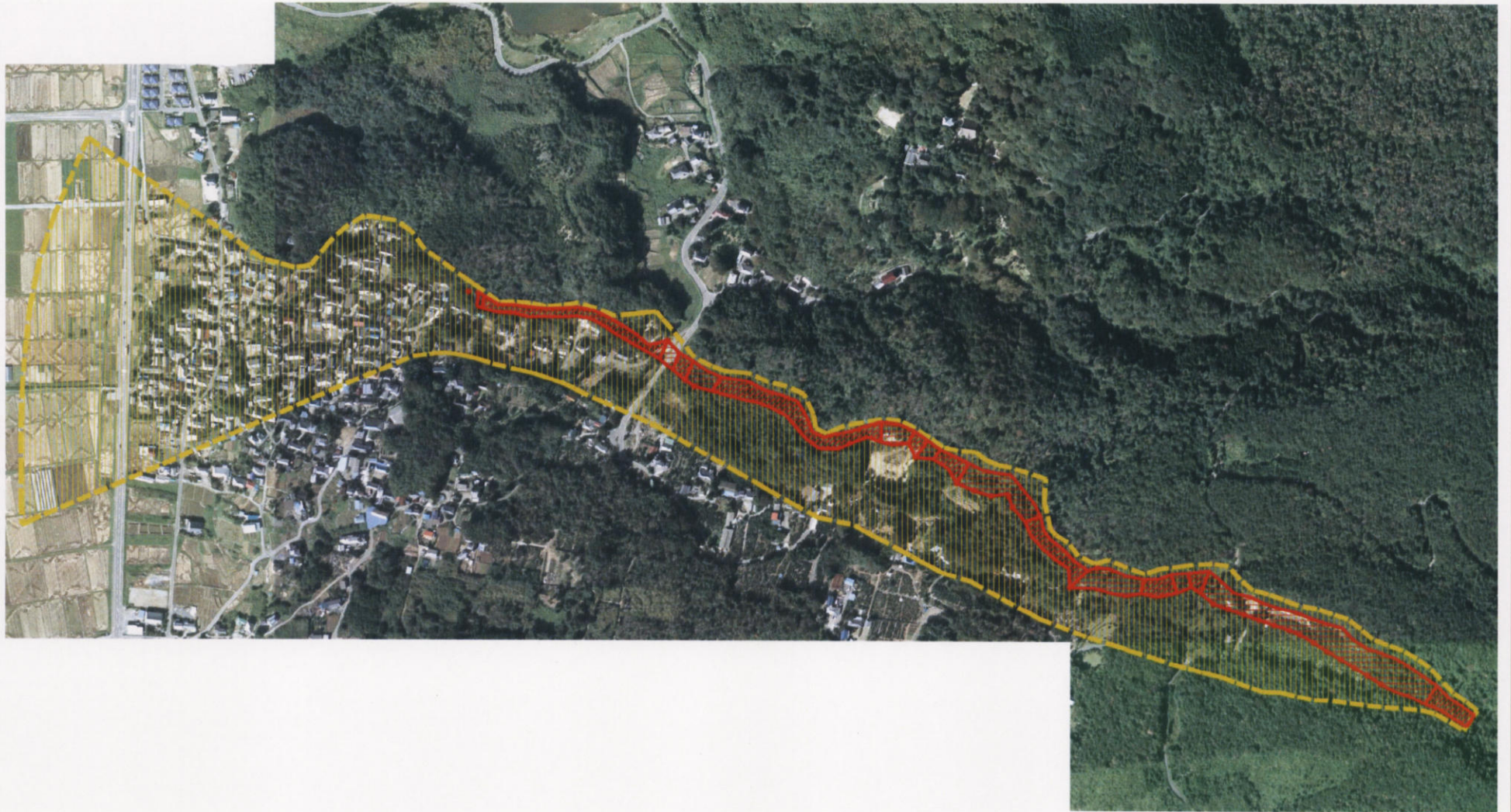
土砂災害警戒区域等の指定の公示に係る図書(その3)