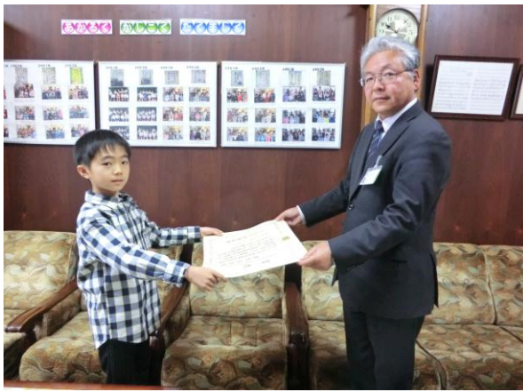
平成24年度 茨城県「土砂災害防止に関する絵画・作文」受賞者一覧

受賞された皆さんおめでとうございました。これからも沢山のご応募お待ちしております。