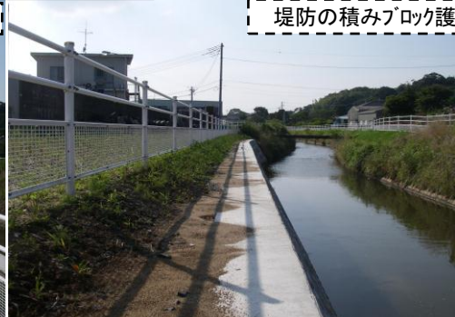
堤防の積みブロック護岸