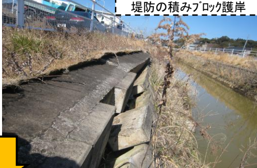
堤防の積みブロック護岸