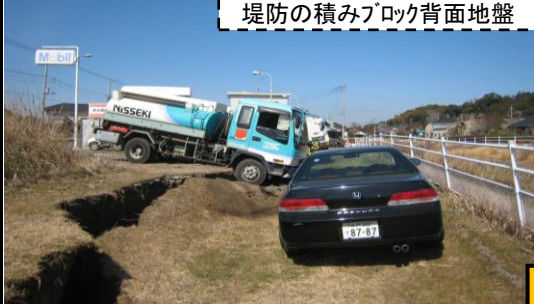
堤防の積みブロック背面地盤