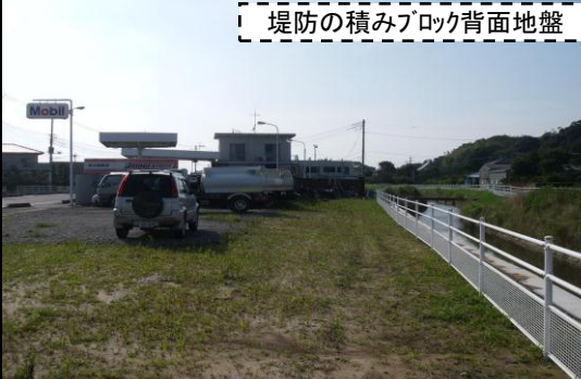
堤防の積みブロック背面地盤