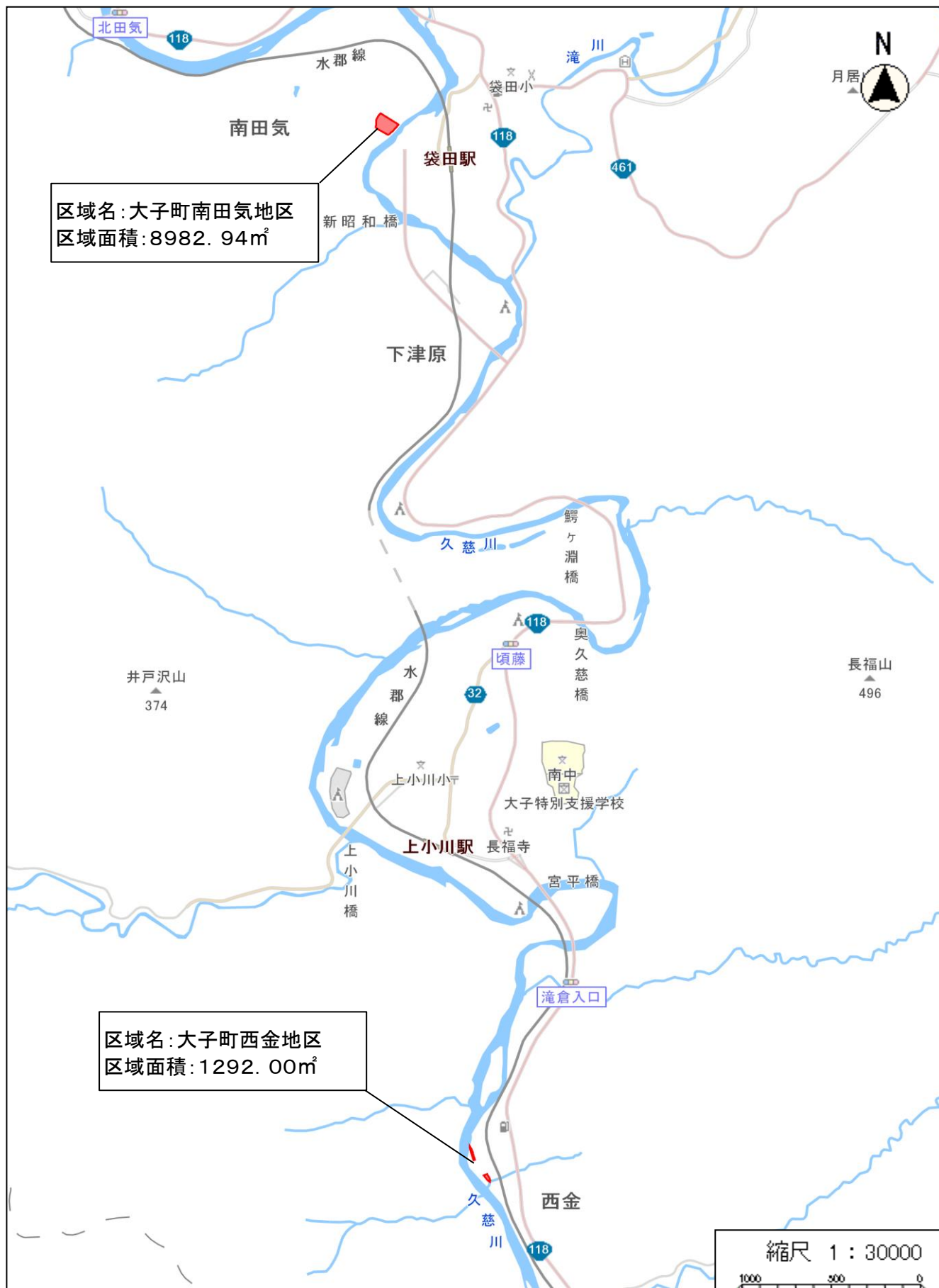
災害危険区域の位置図