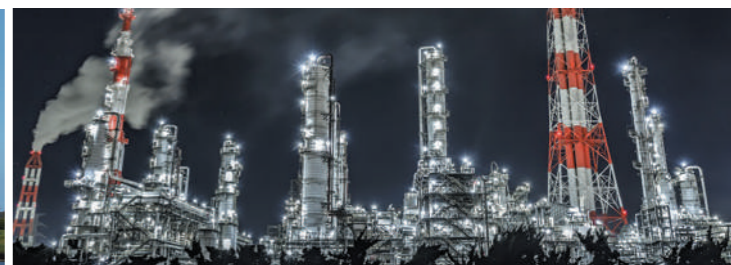
鹿島港の工場夜景