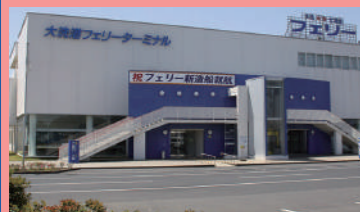
大洗港フェリーターミナル