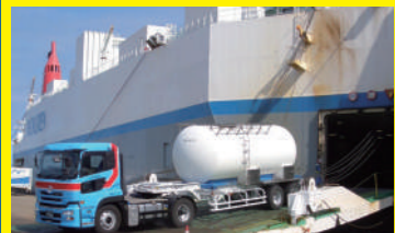
釧路から運ばれてくる貨物