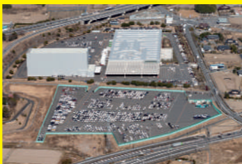
輸入車の新車整備センター