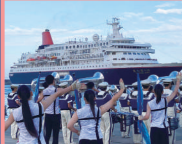
クルーズ船のお見送り