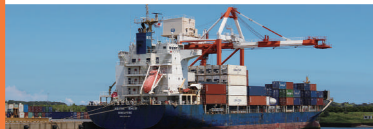
北公共埠頭におけるコンテナ荷役風景

鹿島港は鹿島開発を通して工業港として発展してきました。また、北公共埠頭には外航コンテナ航路や国際フィーダー航路が接続し、南公共埠頭は、飼料等を取り扱うなど流通港としても発展しており、今後さらなる港勢の拡大が見込まれます。