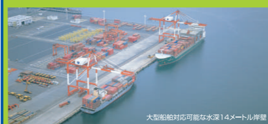
充実した港湾施設

国際海上コンテナターミナルを有する港湾として発展し、栃木県、群馬県を結ぶ北関東自動車道により、京浜港に一極集中している物資の流れを転換し、迅速かつ環境負荷の少ない物流を実現します。