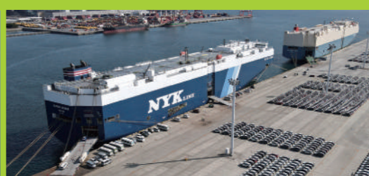
国内外RORO貨物の一大輸送拠点