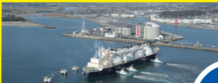
東京ガス(株)日立 LNG 基地