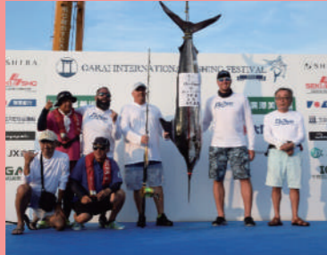
全国初のビルフィッシュトーナメントの国際大会