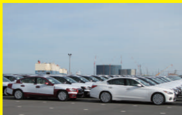
完成自動車の輸出

様々な貨物を取扱う北関東の玄関口として発展し、現在では完成自動車(メルセデス・ベンツ、日産自動車)、石油製品、重油、LNG等を取扱っています。また、釧路定期RORO航路では大型RORO船がデイリー運航され、北海道の新鮮な生乳や農産物が県内をはじめ首都圏に迅速に運ばれています。