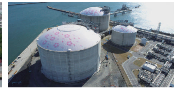
東京ガス株式会社 日立 LNG 基地