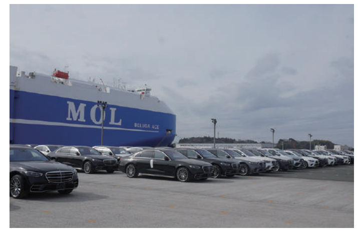
完成自動車の荷役