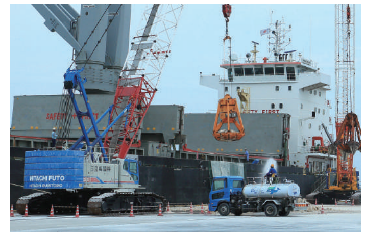
ばら積み貨物の荷役

Port of Ibaraki is situated 95-120km northeast of Tokyo, with Hitachi District located furthest to the north. Hitachi District has 14 public berths on five wharfs. In addition to the 1st and 2nd Wharf Districts that deal with goods such as petroleum and ore products, the 4th Wharf District supports ships that carry out daily services to Kushiro Port in Hokkaido by way of RORO (roll-on-roll-off) shipping routes, aiming to take on the role as the ocean gateway of North Kanto. The 3rd and the 5th Wharf District are operating as Japan's principle import bases for Mercedes-Benz Japan Co., Ltd, as well as handling the North American export of completed vehicles for the Nissan Motor Co., Ltd. In addition to being the import base for motor vehicles, the 5th Wharf District is a site location of the Hitachi LNG Terminal of Tokyo Gas Co., Ltd., and functions as its energy supply base.