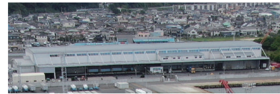
日立埠頭株式会社 物流センター