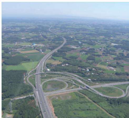
常磐自動車道 友部JCT