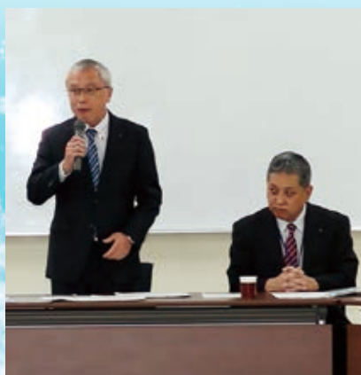
伴釧路市副市長からの歓迎挨拶