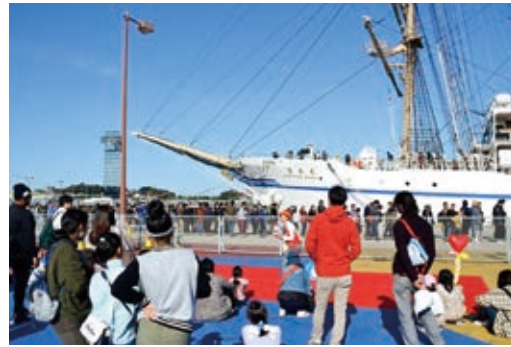
岸壁でのイベントの様子