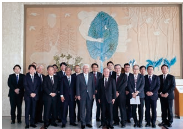
ホクレン本所を訪問

昨年で就航25周年を迎えた釧路定期RORO航路は、北海道で生産された生乳や新鮮な野菜を県内や首都圏へ届けている重要な航路です。今年の4月と5月に2隻のほくれん丸が大型化したことで、更に輸送力が増強されており、日立港区の更なる発展が期待されています。