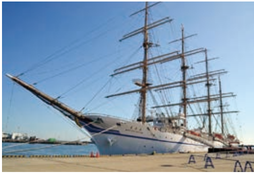
帆船「日本丸」寄港の様子

11月15日(金), 帆を広げた姿が「太平洋の白鳥」と称される帆船「日本丸」が, 大洗港区に寄港しました。16日(土)及び17日(日)には, 船内の一般公開を行い, 約6,000名の方が普段目にするのできない貴重な船内の様子を見学しました。また, 岸壁では「日本丸」の寄港を歓迎し, 大道芸人によるショーやフラダンスなどのイベントのほか, キッチンカーが出店し, 多くの人で賑わいました。