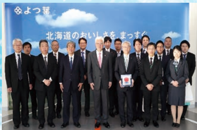
よつ葉乳業十勝主管工場を訪問