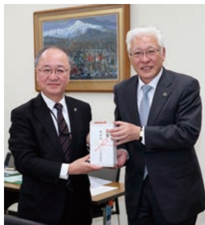
ホクレン板東代表理事専務へ 訪問記念品を贈呈