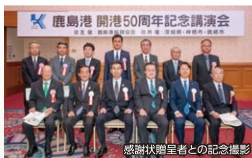
感謝状贈呈者との記念撮影