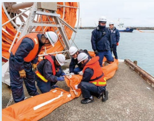
オイルフェンスを接続