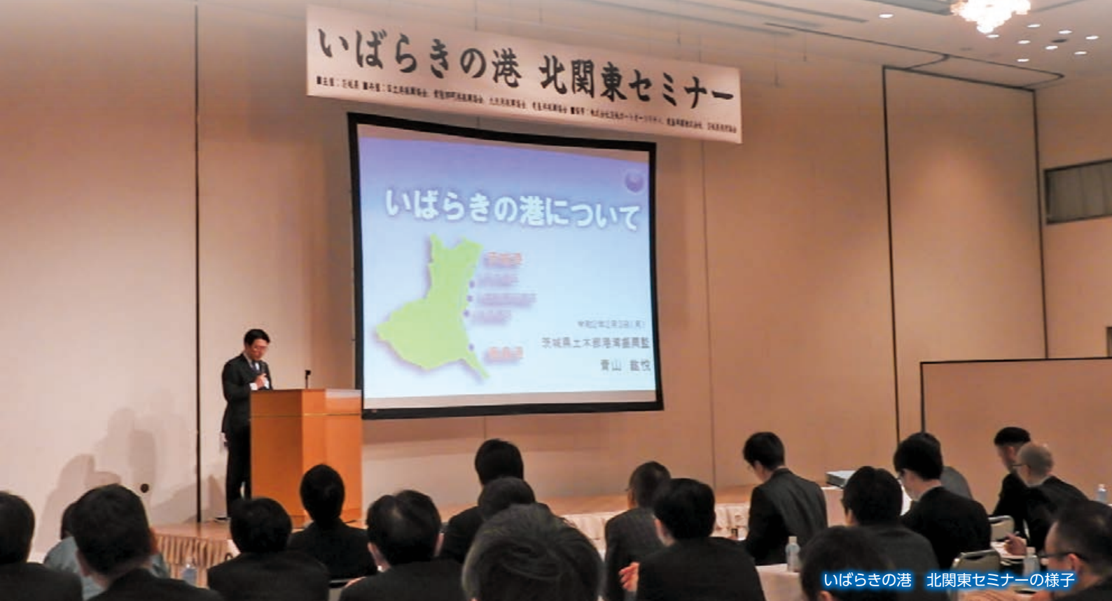
いばらきの港 北関東セミナーの様子