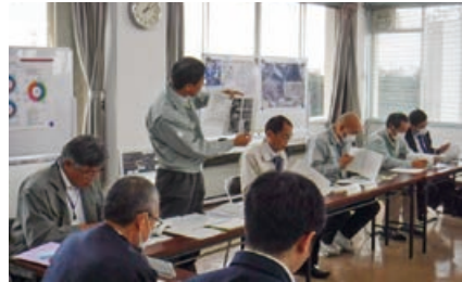
鹿島港保安委員会構成員会議