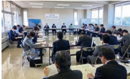
茨城港3港区合同保安委員会

今後,水際対策を強化するために,関係者同士の情報共有を密に図っていくこととし,両会議が終了しました。