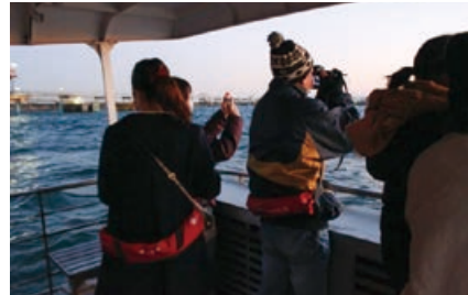
鹿島港の景色を撮影するツアー客