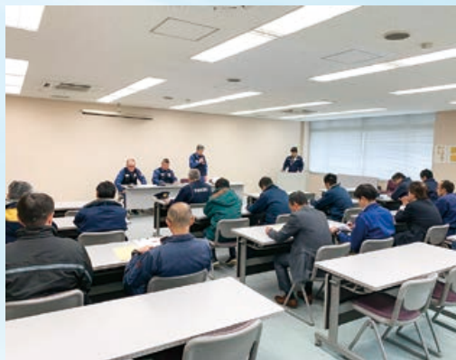
意見交換会の様子