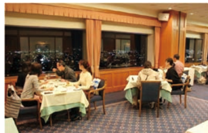
鹿島の夜景を見ながら、夕食を堪能