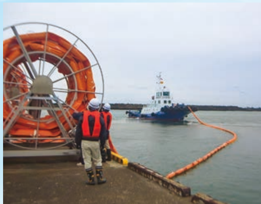
海上にオイルフェンスを展張