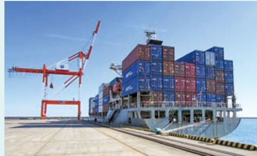
*TEU:20フィートの長さのコンテナ1個を1単位として換算したものです。