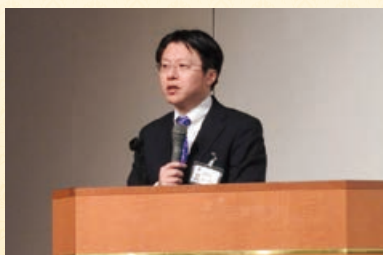
茨城県土木部 青山港湾振興監