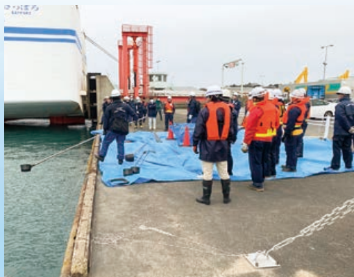
浮流油の回収作業の訓練

訓練終了後は,同港区フェリーターミナルビル内において,有事の際の円滑な対応方法について意見交換を行いました。