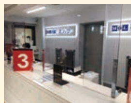
苫小牧港乗船手続きカウンター