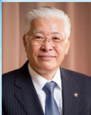
茨城県港湾振興協会連合会 会長(日立市長)