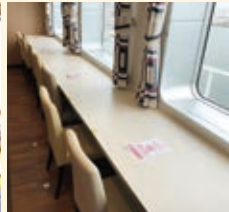
レストラン内の座席