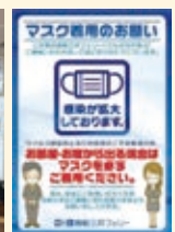
マスク着用 お願いのポスター