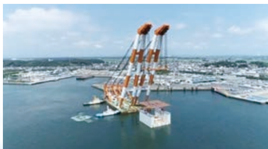
大型起重機船の様子(大洗港区全景)

引き続き、水門の整備や堤防の高上げ工事など、海岸保全のための事業を進めてまいります。