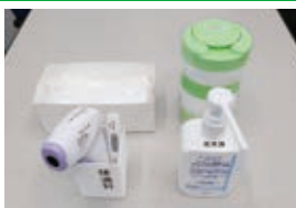
アルコール消毒の設置