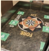
船内エレベーター