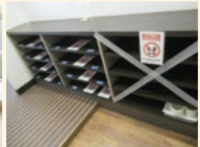
船内大浴場 下駄箱