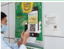
いばらきアマビエちゃんの設置