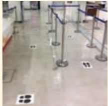
苫小牧港カウンター前