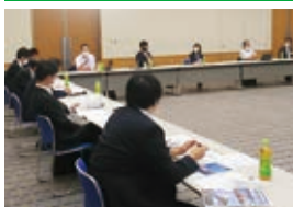
ソーシャルディスタンスを意識した座席の配置