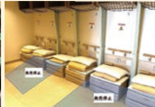
夕方便 ツーリストの間隔空けの様子(一例)