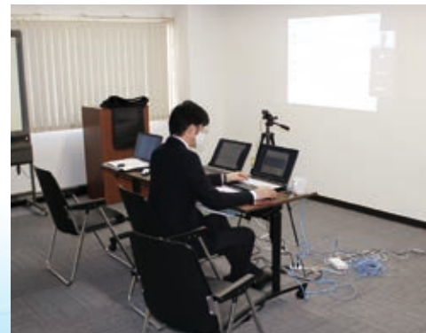
セミナー(事務局)の様子