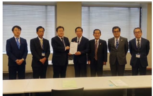
額賀衆議院議員への要望