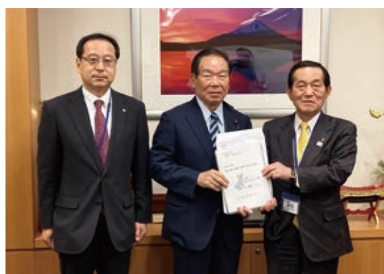
額賀衆議院議員への要望