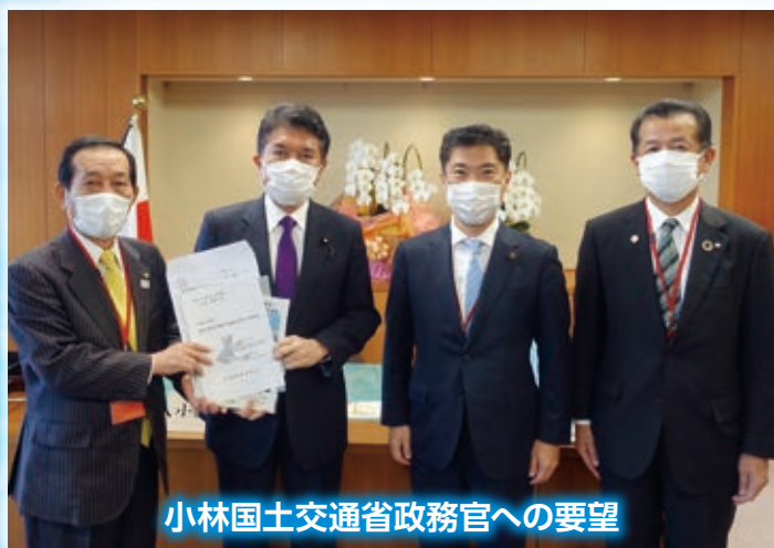
小林国土交通省政務官への要望