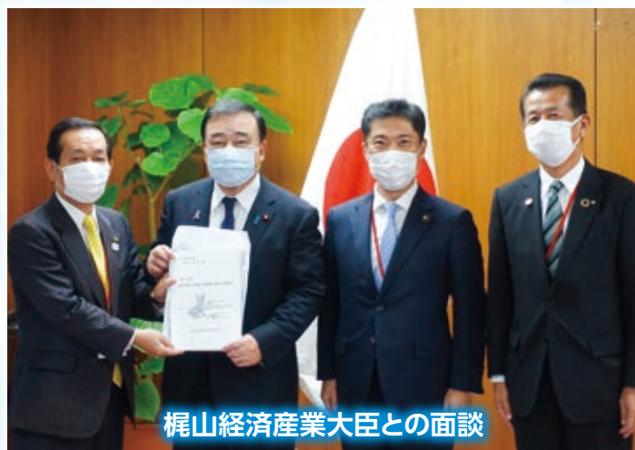
梶山経済産業大臣との面談