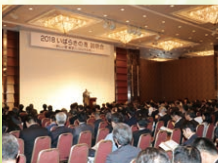
第1部「説明会」の様子