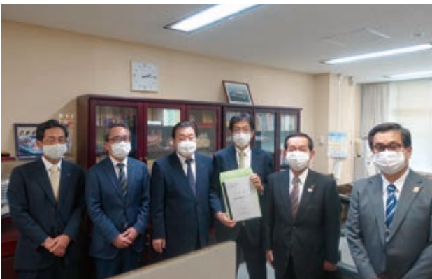
高田港湾局長への要望

さらに、11月10日(火)、国土交通省関東地方整備局を訪問し、交付金事業の予算の増額、補助事業への重点配分などについて要望しました。