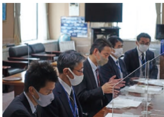
石橋副局長への要望