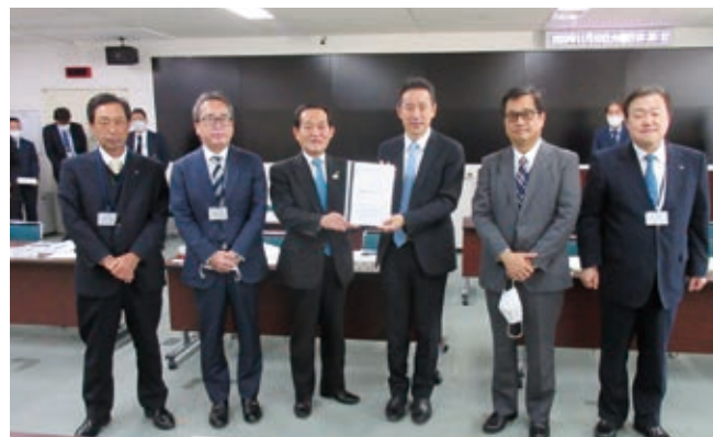
石橋副局長への要望