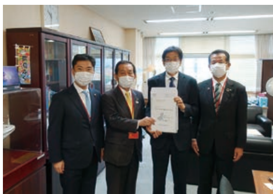
高田港湾局長への要望