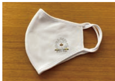
「アライッペ」がデザインされたマスク