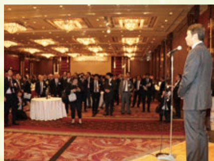
第2部「交流会」の様子