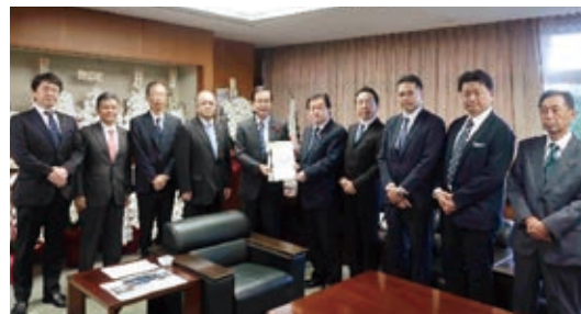
堂故 国土交通副大臣への要望