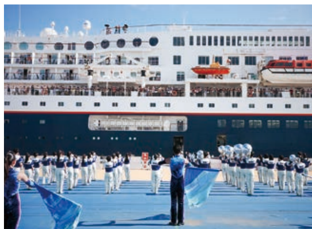
大洗高校による歓迎演奏