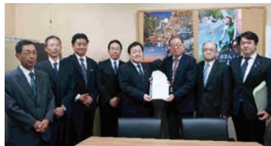
岸川 道路局次長への要望