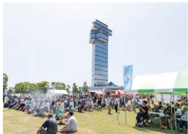
イベント会場の様子