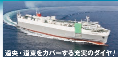
道央・道東をカバーする充実のダイヤ!

日立 14:00入港 - 18:00出港 / 釧路 14:00入港 - 18:00出港