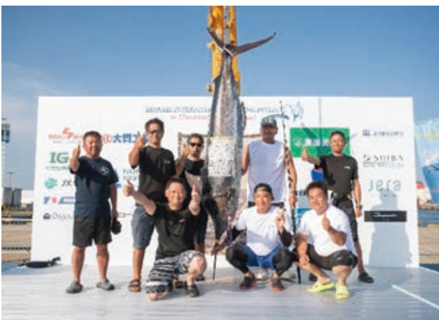
カジキ検量式の様子