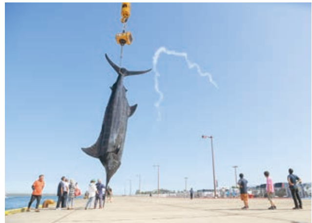
釣り上げられたカジキとエアショーの様子