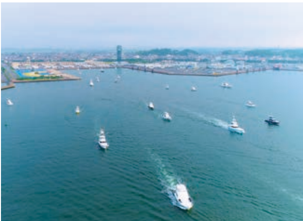
大会参加艇の出港

カジキ釣り国際大会には39隻、約210人が参加し、計8本のカジキが釣り上げられ、陸上のイベントには3日間で約13,000人が訪れました。