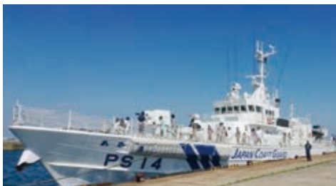
海上保安庁巡視船一般公開