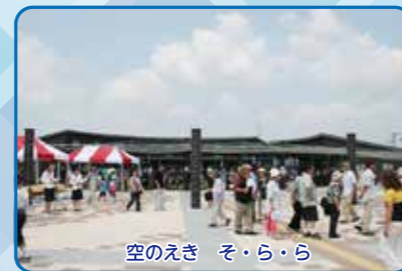
空のえき そ・ら・ら