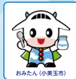
おみたん (小美玉市)