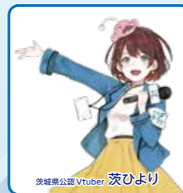
茨城県公認VTuber 茨ひより