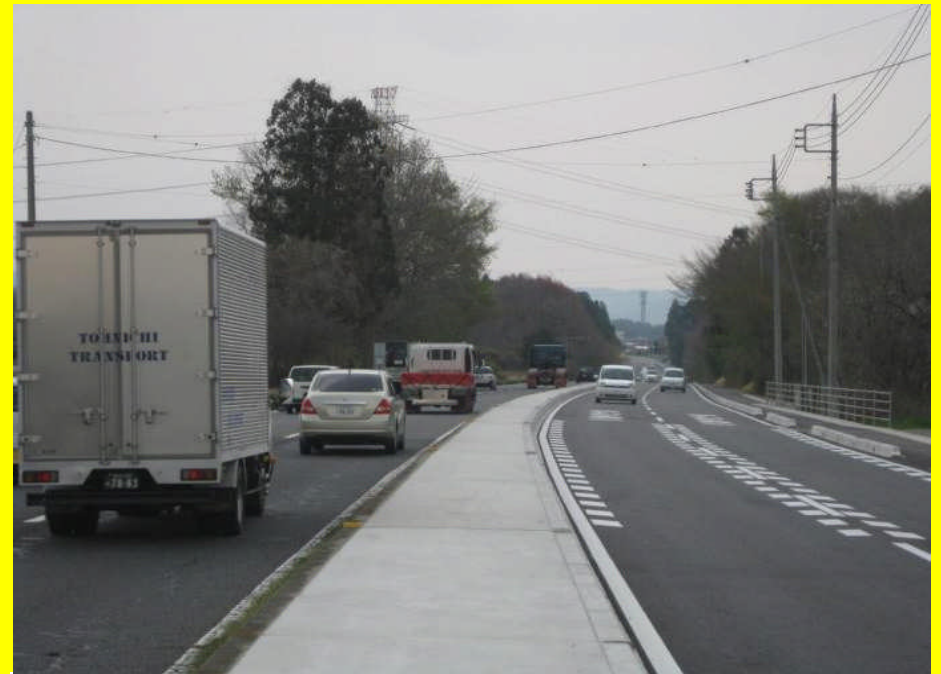
4車線化整備完了後の状況