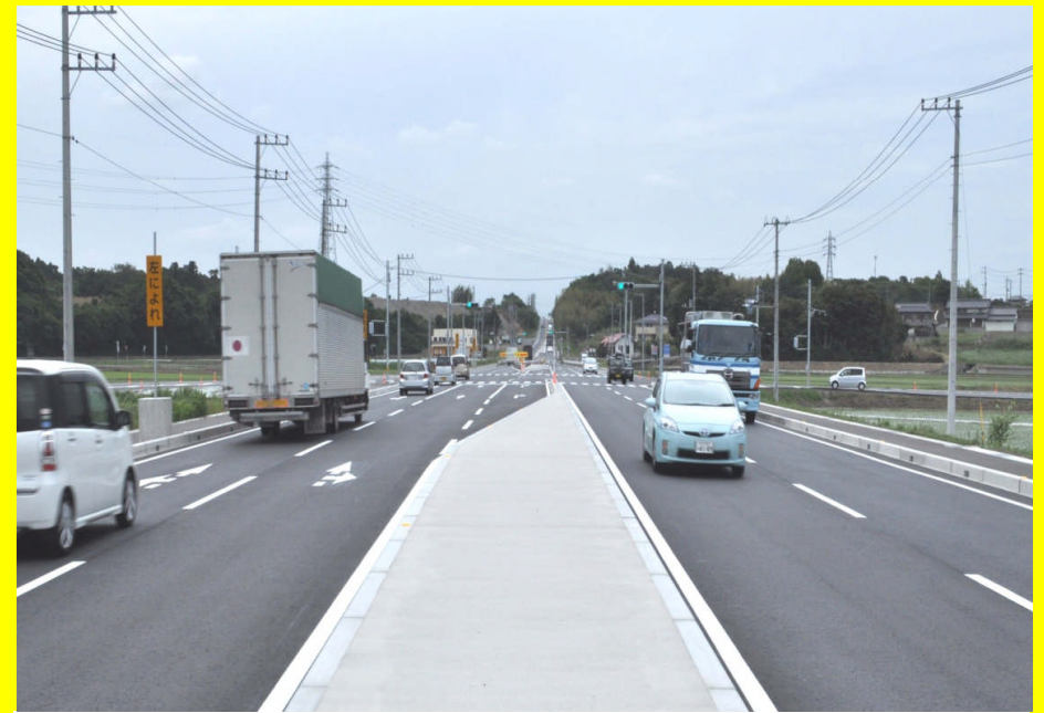
4車線化整備完了後の状況