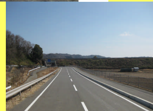
今回整備したバイパス道路