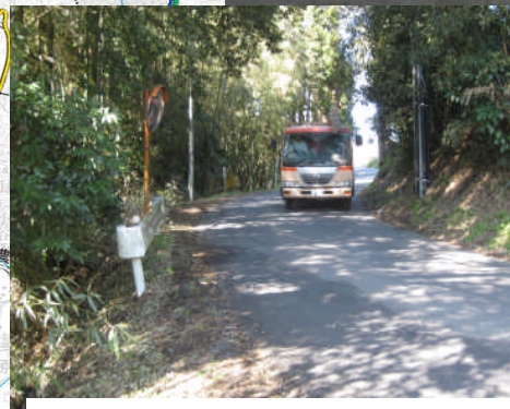
狭隘で屈曲している現況道路