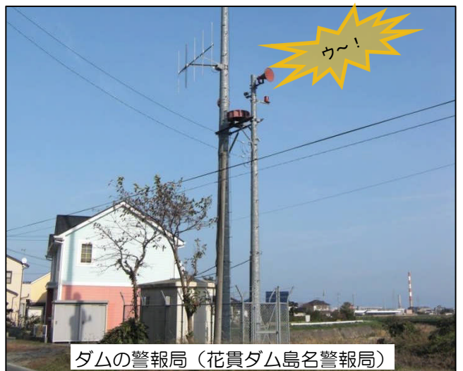
ダムの警報局（花貴ダム島名警報局）

ダムのサイレンが鳴ったら、川の水位が急に上昇して危険ですので、 すぐに川から離れて下さい。