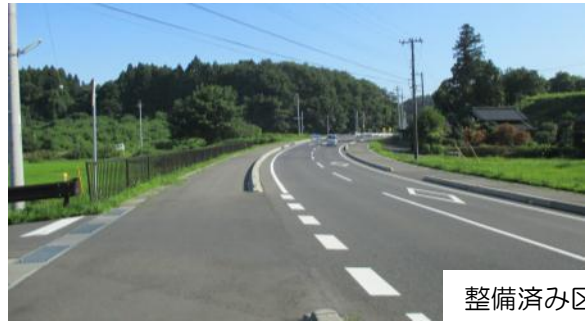
整備済み区間写真