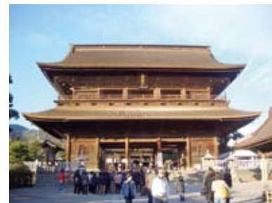
山門 (三門)【国指定重要文化財】

善光寺周辺では電線の地中化や道路の美装化を行い、美しいまちなみの形成に努めています。上記の写真のような歴史的建築物や風景は国民の財産であり、地元住民にとっては宝であると同時に誇りでもあると思います。