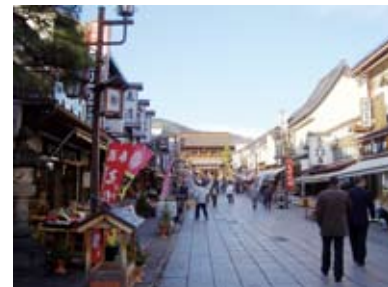
山門までの参道石畳

長野市では、景観形成への取り組みも行われています。その中でも、善光寺周辺地区は、約1,400年前に開かれた善光寺を中心とした門前町で、土蔵づくりの商家の街なみなど特徴ある景観が残されていて、参道を歩いていると歴史と文化の香りが漂うまちなみに魅了されました。