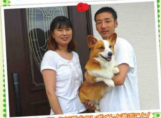
休日の楽しみは愛犬のレボくんと遊ぶこと!