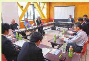
まち協:平成28年度 総会