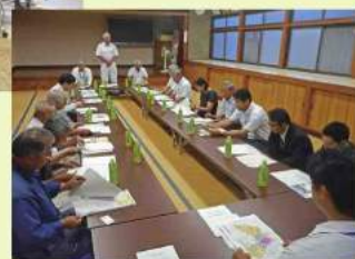
阿見吉原地区地権者の会 第2回総会