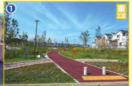
完成した『ふれあいの社公園』