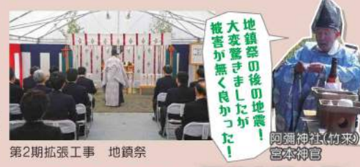
第2期拡張工事 地鎮祭

この3.11“A・Y”と“APO”とのエピソード! 地域の新たなる物語として心に記憶しておきましょう!