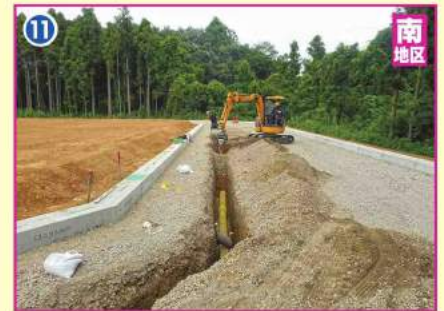
上・下水道、ガス管等敷設工事