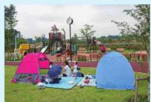
暑さ対策もバッチリ! 晴れた日のピクニックは最高!

他の公園にはない魅力いっぱいの『ふれあいの杜公園』!今年度は、隣接する『街区公園』が整備される予定です!