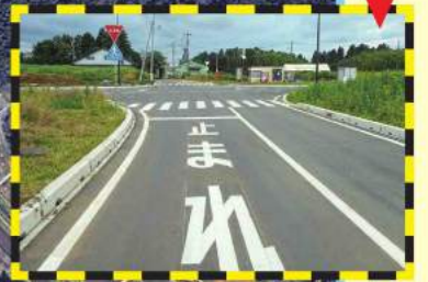
『赤太郎通り』×『町道0207号線』 交差点: 交通事故注意ポイント!