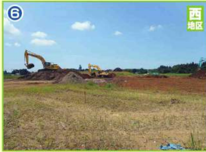
宅地造成工事(大街区)

急ピッチで進む各工事を『安全かつ円滑』に実施するために毎週、工事関係者による『全体調整会議』が行われております。