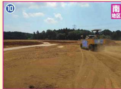
宅地造成工事(大街区)