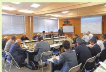
第18回審議会・第24回協議会