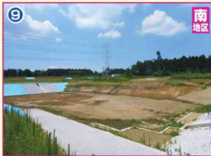
調整池築造工事(第3調整池)