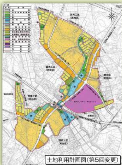
土地利用計画図(第5回変更)