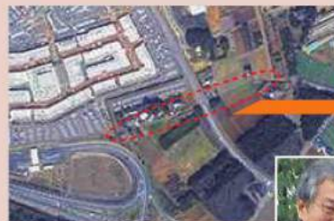
『両市町』にまたがる “阿吽の道”はここ!

『阿吽の呼吸』とは、よくぞ言ったモノで今後、両市町とも、お互 いに、この『阿吽の道』の管理をよろしくお願い申し上げます。