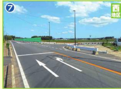
県道土浦稲敷線道路改良舗装工事