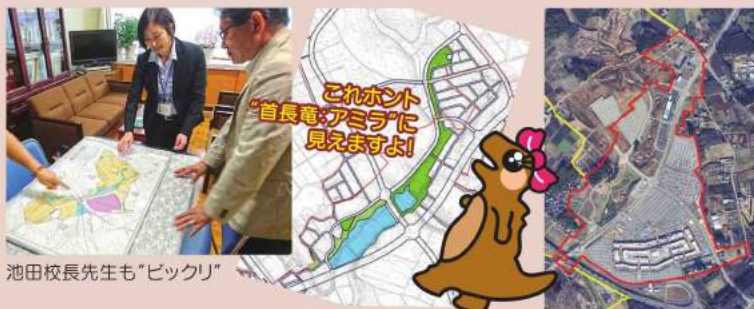
池田校長先生も“ビックリ”

この“アミラ”は地図に記されると共に地域の方達の“憩いの場” として、これからもずっとA・Yを見守り続けていくこととなります!