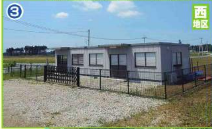
移転された現地事務所