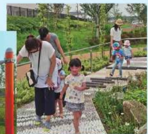
恐怖の踏み石ゾーン! あまりの痛さに絶叫する ママさん達!