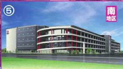
マルチテナント型物流センター完成予想図