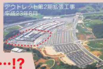
アウトレット第2期拡張工事 平成23年8月