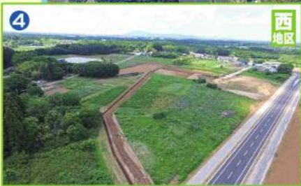
今年度整備予定の『共同利用B街区』用地