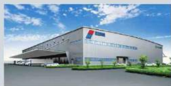
首都圏ケミカルセンター ※日立物流:化学品倉庫 (境古河IC:約4.5ha)