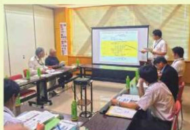
第1回広報・土地活用部会