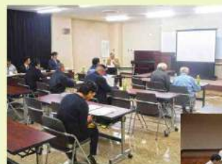
共同利用B街区の会 第2回総会