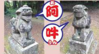
神社狛犬にみられる“阿吽”の呼吸! /阿彌神社(竹来)