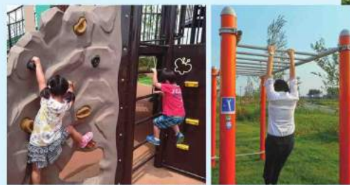
アスリート顔負けの身体能力です! 大人も健康遊具でリフレッシュ!