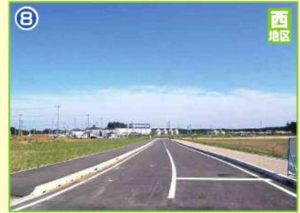
開通した『いぶきの杜通り』