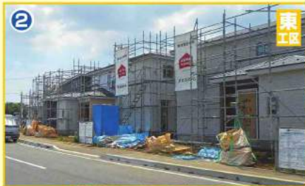
進む住宅建築工事