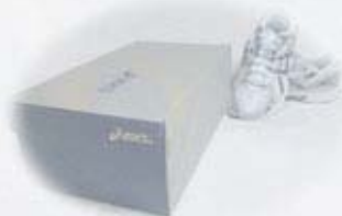
シューズボックスをイメージした外観