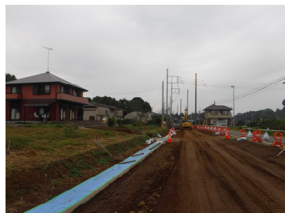
【県道島並鉾田線施工中】