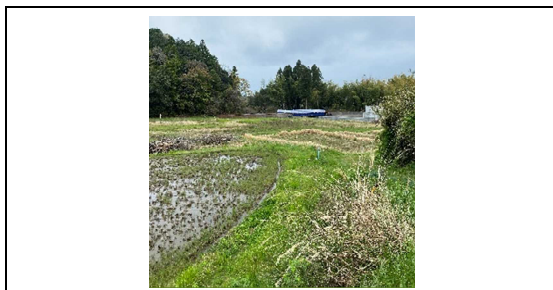
【令和2年4月進捗状況】

高萩工事事務所職員と共に地元地権者を訪れ理解と同意を求め、用地取得を推進。令和2年度予算にて地盤改良工事に着工した。