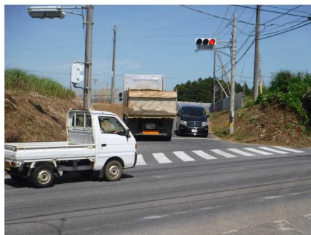
【県道荒井行方線バイパス（予定地）西側】