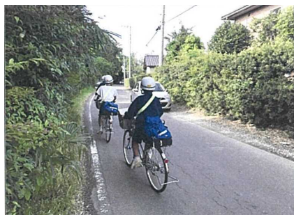
【県道島並鉾田線施工前】

そのため、歩行者等の安全確保や地域交通の円滑化が図られるよう、歩道の整備や道路の拡幅による狭小な箇所解消について、地域から要望を受けていることから、整備の促進を図るため、県の関係部署への要望活動等を行った。