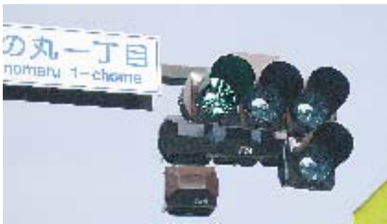
県内に導入が進む発光ダイオード(LED)を使った信号機

数も長いというメリットがあり、信号に西日が当たって見づらくなるような緊急性の高い箇所に積極的に整備したいと答えました。