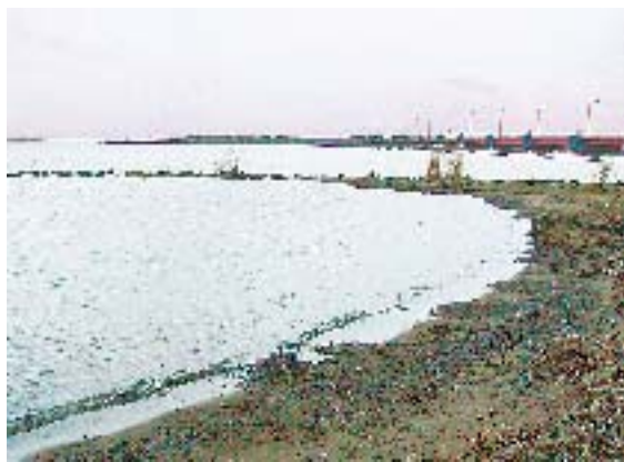
早期水質浄化が望まれる霞ヶ浦