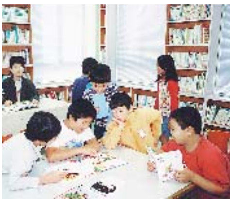
学校図書館の利用風景