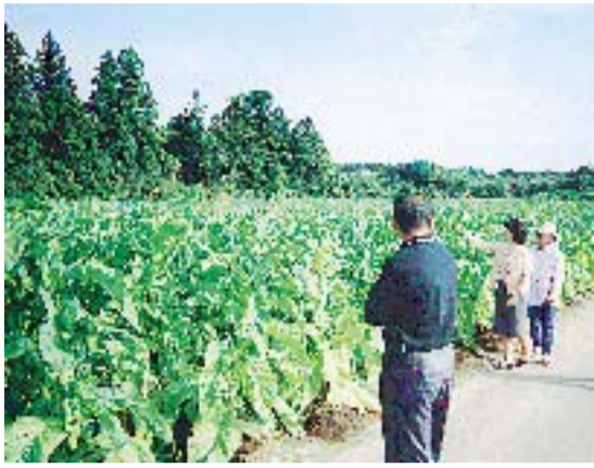
葉たばこの生育状況

医療体制整備 検討委員会の 提言などを踏 まえ、地域救 急センターの 早期設置に向 け、なめがた