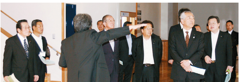
理科教育の充実に取り組む麻生中学校で説明を受ける委員