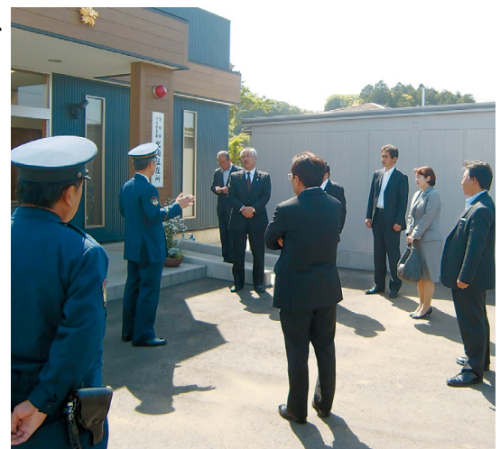
再編整備された北浦駐在所で説明を受ける委員