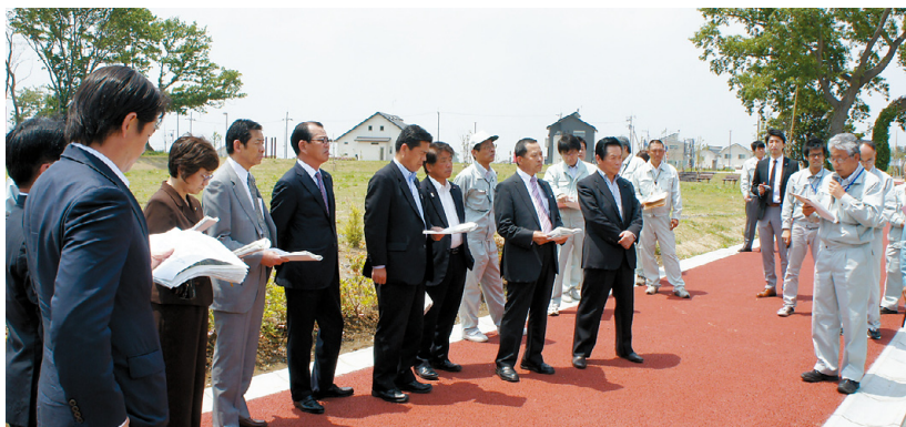
区画整理事業地内で進捗状況の説明を受ける委員

つくばエクスプレスみらい平駅周辺において進められている伊奈・谷和原丘陵部一体型特定土地区画整理事業及び都市軸道路整備事業の進捗状況について、現地調査を行いました。