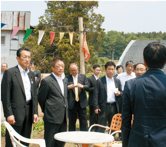
障害者スタッフが運営する農園で説明を受ける委員

特定非営利法人つくばアグリチャレンジは、障害者の能力を生かして農業の担い手を育てることを目指しています。農業を通じた障害者の雇用拡大・就業支援や野菜の宅配サービス・新商品開発への取り組み状況などについて説明を受け、その後、施設や耕作放棄地を調査しました。