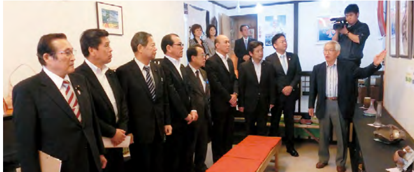
情報発信によるまちの活性化について説明を受ける委員

鹿嶋人ギャラリーは、空き店舗を活用した手芸品販売や、鹿嶋を紹介する情報の発信を通じまちの活性化を図るとともに、歴史と伝統ある文化財や豊かな自然に触れるウォーキングコース「鹿嶋 神の道」を運営しており、これらについて調査を行いました。