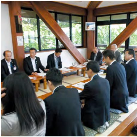
バンジージャンプを活用した地域の活性化について説明を受ける委員

常陸太田市では、竜神大吊橋において今年の3月から新たにバンジージャンプというスポーツ観光を取り入れ、県北地域の誘客促進と地域の活性化を図っています。開始以来、順調に伸びている渡橋者数や物産センターの売り上げ状況、また今後の計画などについて調査しました。