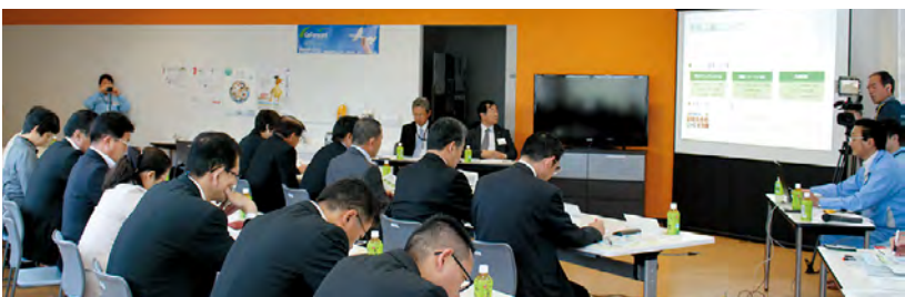
ジェネリック医薬品の製造工程などの説明を受ける委員