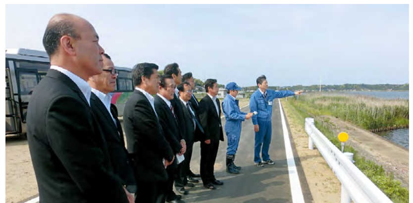
武田川ウエットランドを調査する委員

霞ヶ浦河川事務所における霞ヶ浦の水質浄化の取り組みについて説明を受けた後、武田川ウエットランド※の調査を行いました。