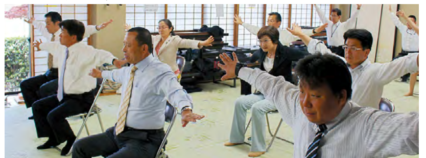
シルバーリハビリ体操を体験する委員

シルバーリハビリ体操を取り入れた介護予防事業などについて説明を受けた後、1級指導士による3級指導士養成講習会を視察するとともに、実際に体操に参加しました。