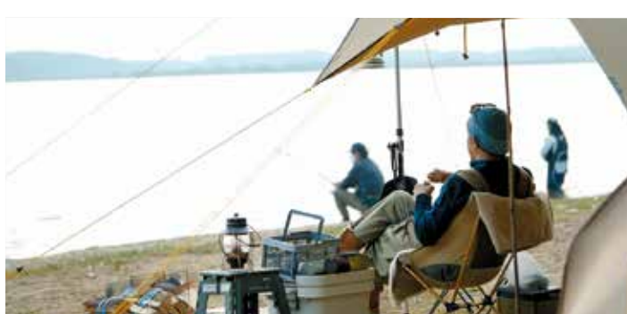
ソロキャンプを楽しむ様子

議員 茨城県をアウトドアの聖地として売り出すべきと考えるが、取り組みをどう進めるのか。 知事 本県がアウトドアの聖地として確立するためには、多様なアクティビティが楽しめる「体験王国いばらき」のイメー