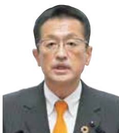
石井 邦一 議員 いばらき自民党 常陸太田市・大子町選出

https://ibaraki-pref.stream.jfif.jp/?tpl=gikai_result&gikai_id=159