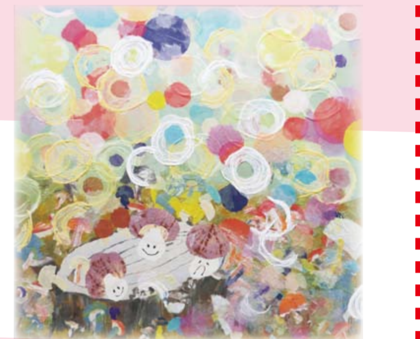
絵画の部「森の夢」 障害者支援施設はまなす荘 はまなす荘利用者のみなさん