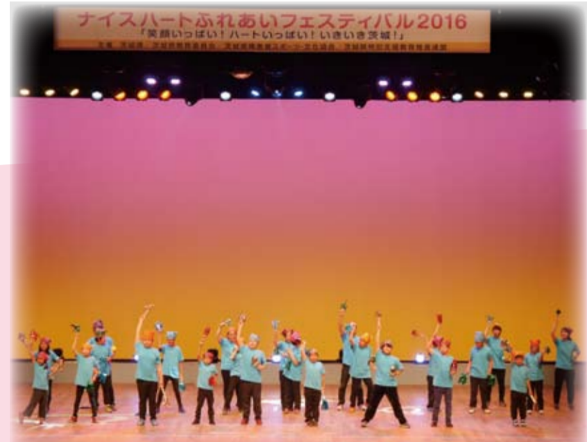
茨城県立勝田特別支援学校のみなさん 「Step by Step ～威風堂々～」