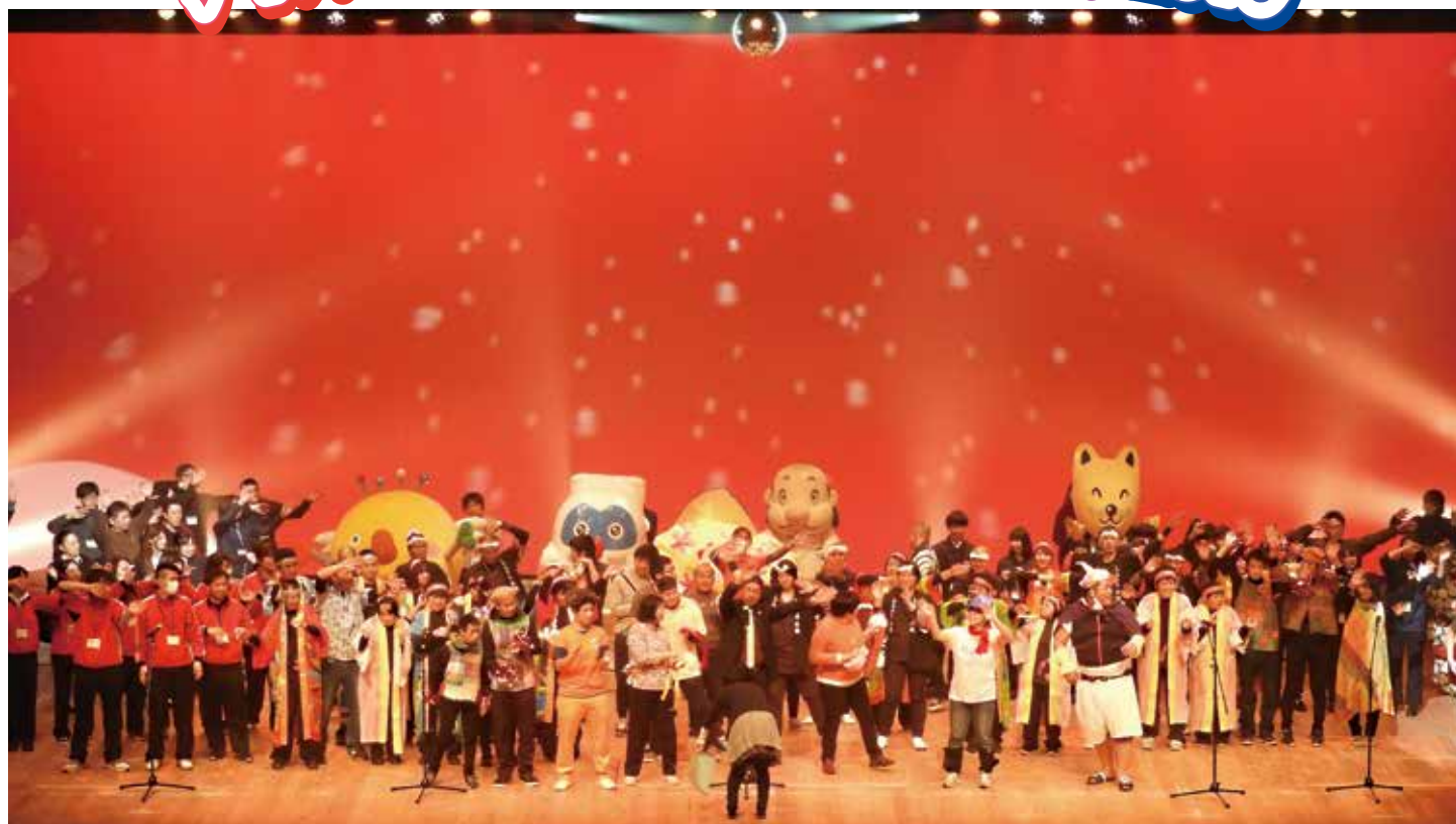
ナイスハートふれあいフェスティバル2019「フィナーレ」