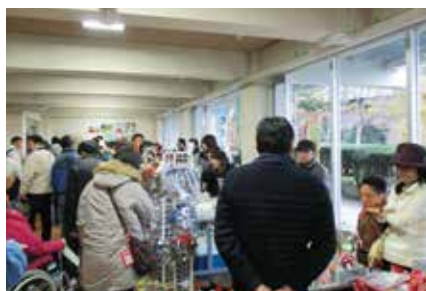
■作品販売(ホール内ロビー)