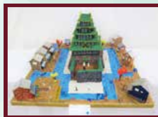
最優秀賞 陶芸・工芸の部 石崎病院男子グループさん ※来場者投票賞同時受賞