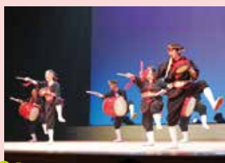
潮騒ジョブトレーニングセンター