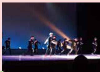
クオリティ・オブ・ライフ