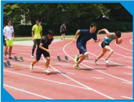
強化練習会（陸上競技）

また、障害者スポーツの普及・振興を目的としたスポーツ教室を計4回開催し、参加人数は289人でした。スポーツ教室は県内各地で開催しており、どなたでも参加できますので、お近くで開催の場合はぜひご参加ください！