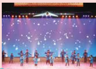
キッズルーム ばんびーに