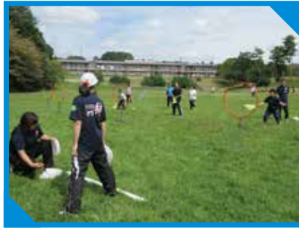
強化練習会（フライングディスク）