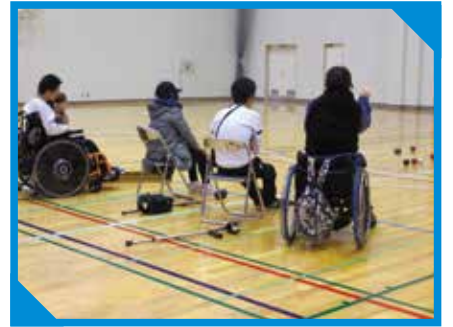
体験教室（ボッチャ）