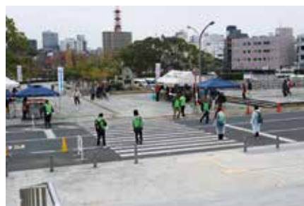
■作品販売(正面階段前広場)

12月7日(土)に大ホールロビー、中庭及び正面階段前広場で開催した作品販売には、障害者施設、作業所等30団体の出店がありました。あいにくの雨でしたが、店先には、障害者が栽培した野菜、手作りのパンや菓子類、手芸品や木工品等が所狭しと並べられ、来場された方々と各施設の活気ある呼び込みの声で賑わっていました。