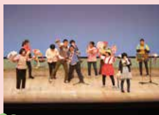
ユーアイファクトリー