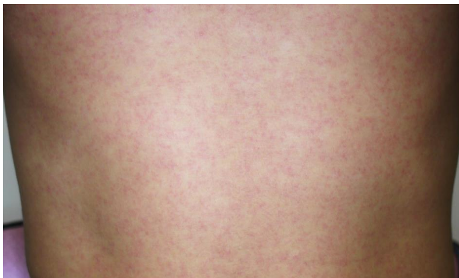
図3. ジカウイルス病の斑状丘疹様の発疹

潜伏期間は、2～12日（多くは2～7日）である。ジカウイルス病の臨床症状は多彩であるが、斑状丘疹様の発疹（ 図3 ）は90～100%に認められるのに対して、発熱の頻度は35～65%とされている 25,45,46 。また発疹は掻痒感を伴うことが多いとされている。また、大半の症例は入院を必要としなかった。 表7 に2015年のブラジル・リオデジャネイロにおけるジカウイルス病患者が発症後4日以内に認めた臨床症状を示す 45 。