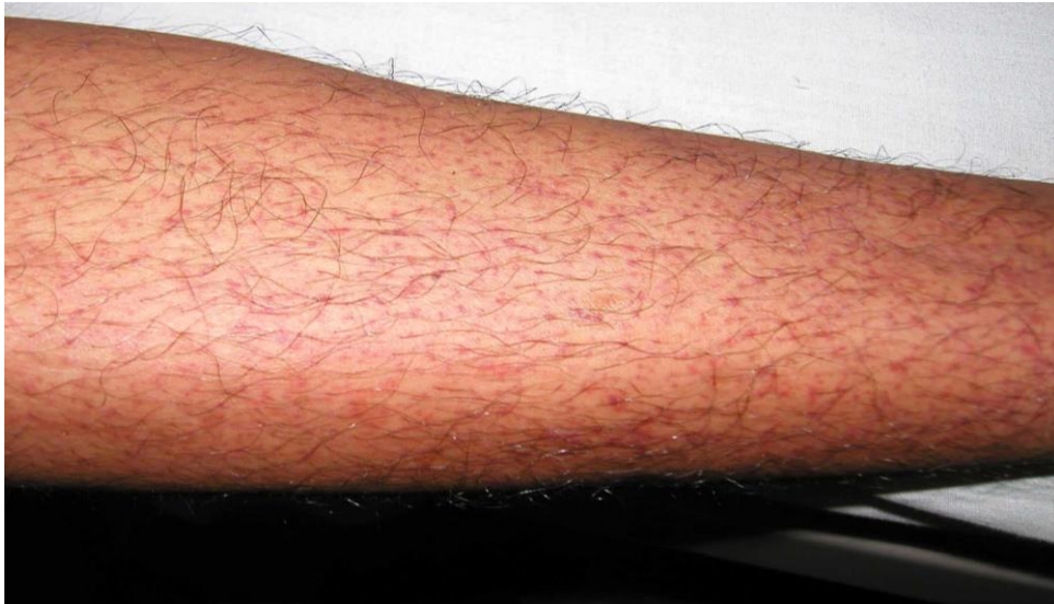
図 1. デング熱患者の発疹：解熱時期にみられた点状出血