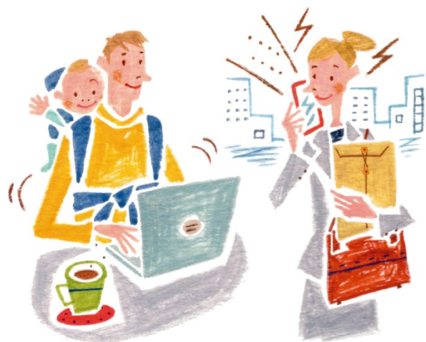
多様で柔軟な働き方の推進