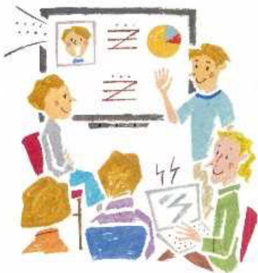
デジタル技術を活用した業務改革