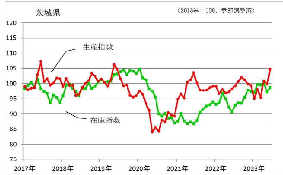
鉱工業生産指数、在庫指数の推移