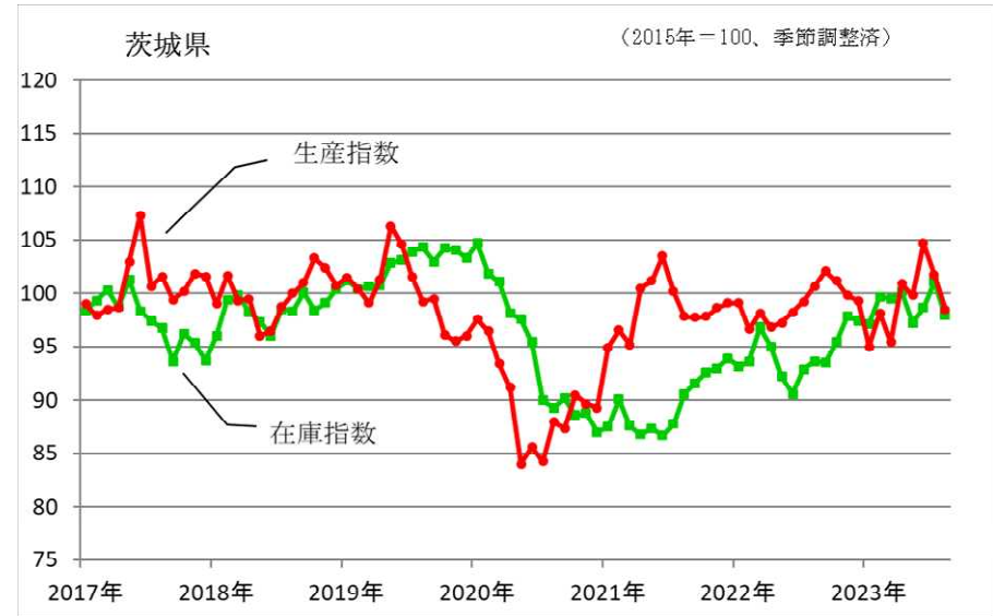
鉱工業生産指数、在庫指数の推移