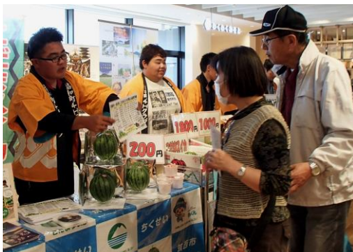
右上：参加したクラブ員 左下：こだまスイカをPRするクラブ員

クラブ員は自分の作った農産物を都内でPR・販売できることもあり、糖度などの品質や生産方法を説明するなど、積極的に農産物をアピールしていました。こだまスイカを試食した方々からは「甘くておいしい！」「いちごよりも甘い！」と大好評で、多くの人がこだまスイカの魅力を体感していました。