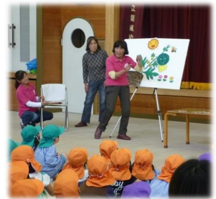
パネルシアターを使って園児に説明

最後に、女性の会が寄贈したこだまスイカをその場で切って、園児達に振る舞い、一足早い夏の味を楽しんでもらいました。園児達は何度もおかわりをしたり、スイカの種を家で播くのだと大事そうに持って帰ったりしていました。