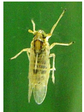
ヒメトビウカの成虫

飼料用品種などのイネ縞葉枯病抵抗性品種では本病の被害は発生しませんが、ヒメトビウカは吸汁し、ウイルスも持ち込みます。他のほ場での被害を防ぐために本田防除を実施してください。