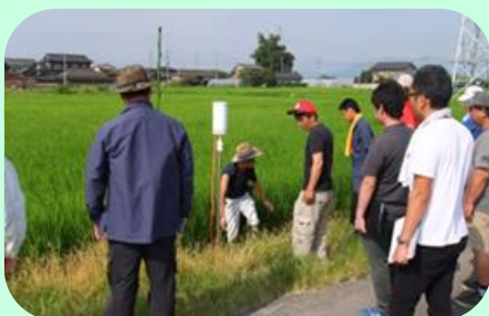
㈱ライス&グリーン石島ほ場視察の様子