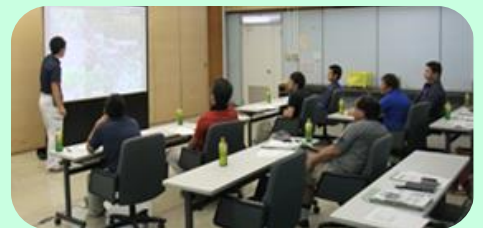
普及センター職員による講義

講義後は現地へ移動し、JA常総ひかりが主催する茎葉除草剤散布省力化資材「ラウンドノズルUL V5」実演講習会に参加しました。この資材は、除草剤を細かい粒子として噴霧する特殊なノズルで、少ない水量で散布できるため、薬液を補充する回数を削減でき、作業時の負担軽減に繋がります。受講生は、水稻栽培における省力化の重要性を再認識した様子でした。