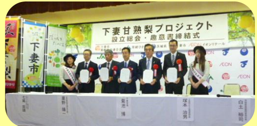
下妻甘熟梨プロジェクト設立趣意書締結式

今回のプロジェクトの設立は、若手生産者5名からなる下妻梨PRプロジェクトチームが「梨本来の旬のおいしさを伝える」目的で始めた活動が認められたものです。設立総会において、下妻市の菊池市長は「イオンとの連携により、産地活性化を期待している。後継者が育つような産地とするため、可能な限りバックアップしていく。」と期待を表明しました。プロジェクトでは、販売会等のPRにより「下妻甘熟梨」のイメージアップを図り、販売をサポートしていきます。