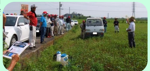
茎葉除草剤散布省力化資材実演講習会

その後、下妻市で水稻栽培の省力化技術やICT技術導入に取り組む(株)ライス&グリーン石島を視察しました。受講生は、自動給水装置を設置したほ場や乾田直播ほ場を見学し、新技術についての質疑も活発に行われ、管内を代表する先進農家の取組に刺激を受けていました。