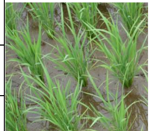
写真: 中干し開始適期のコシヒカリ 茎数20本/株程度