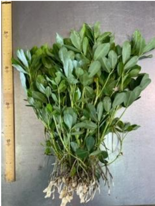
農研所内圃場における ナカテユタカの生育状況 (7月28日撮影)