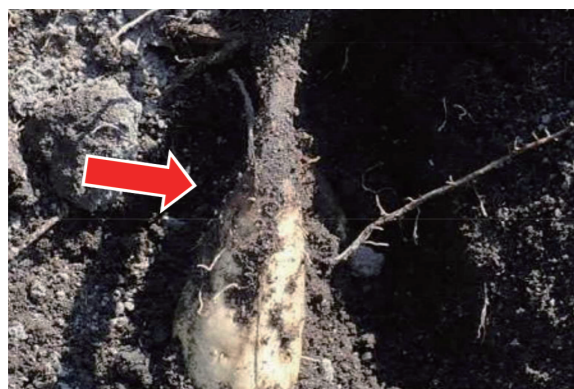
黒変がなり蔓から塊根へ到達