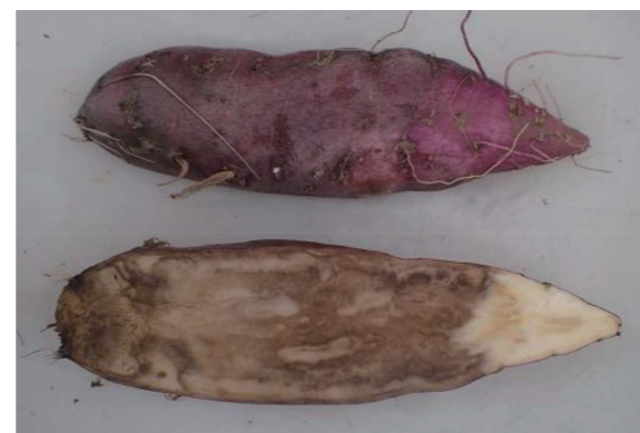
なり首側からの塊根腐敗