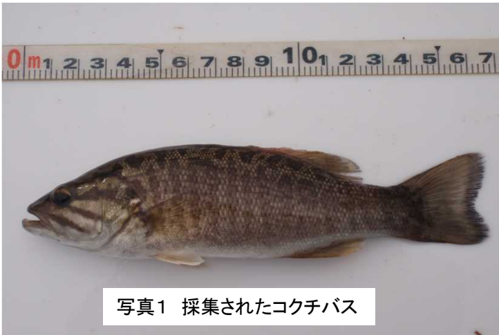
写真1 採集されたコクチバス