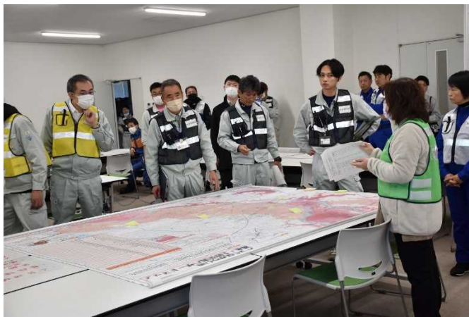
市職員による訓練