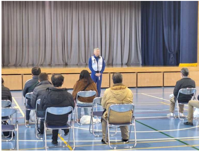
つくばみらい市長による講評