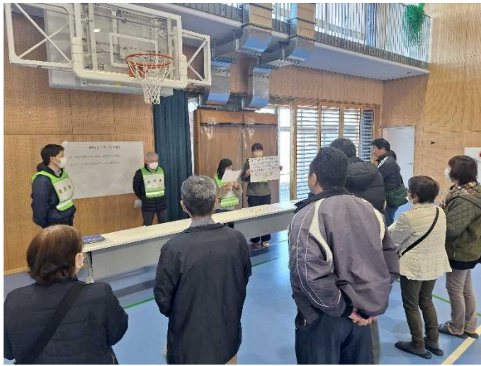
防災士による防災クイズ