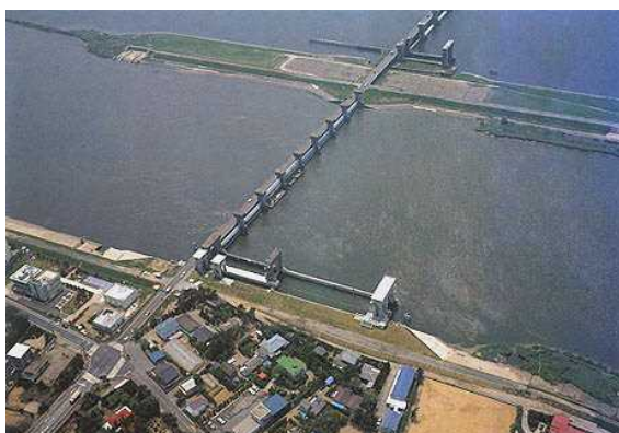
図 4 常陸川水門の全景

利根川からの逆流を防ぎ、同時に利根川経由で遡上する塩水がもたらす塩害を防止するため、利根川と常陸利根川の合流地点に水門をつくることにしました。この常陸川水門は昭和 34 年（1959 年）に建設が開始され、昭和 38 年（1963 年）に完成しました（図 4、5）。