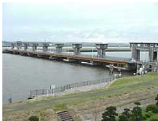
図 5 常陸川水門