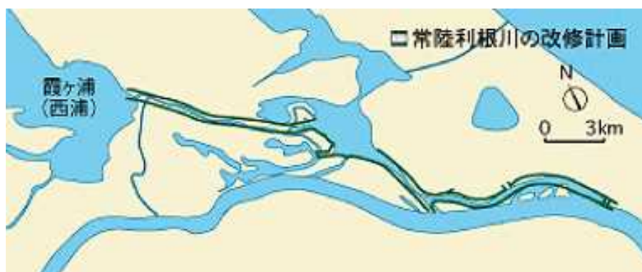
図 3 常陸利根川の河道拡幅

この計画を実現するには、常陸利根川の排水能力を高めなくてはならなかったため、図 3 に示すように、昭和 23 年（1948 年）に常陸利根川の 12.5km の河道を 182m 幅から約 2 倍の 280～320m 幅に広げる工事が開始されました。