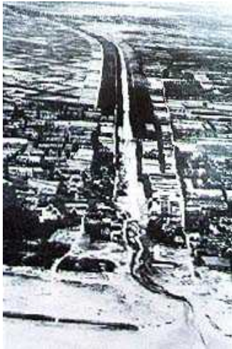
図1 昭和43年頃の居切堀

しかし、この工事が終わっても、霞ヶ浦の洪水時の貯水量に比べて、常陸利根川の河道幅があまりにも狭いため、沿岸の人々はたびたび水害に悩まされました。