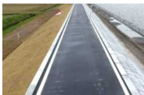
図8 波浪による堤防浸食防止のための護岸整備(整備前(左)と整備後(右))