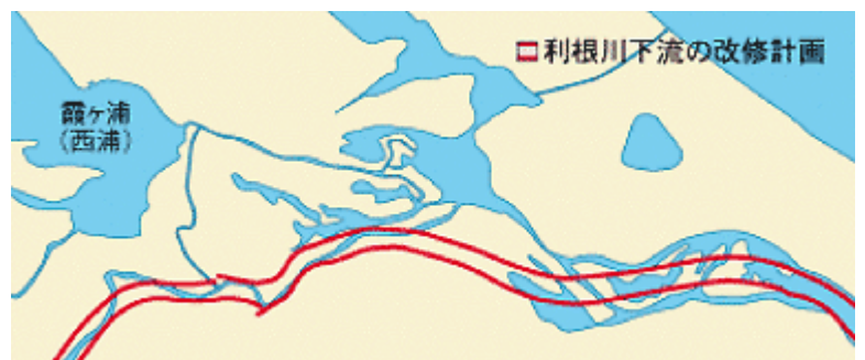
図2 明治期中期の改修工事