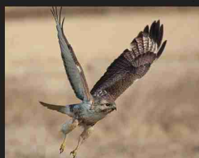
ノスリ /55cm/ 通年