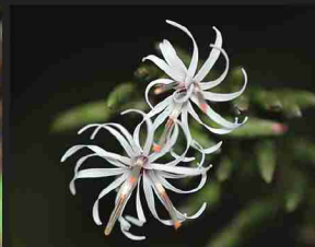
オクモミジハグマ (8-10月)