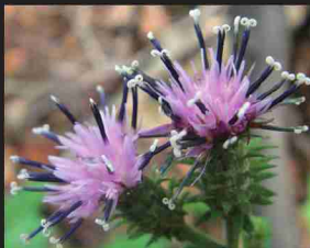
アサマヒゴタイ (9-10月)