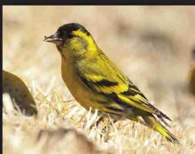
マヒワ /12cm/ 冬