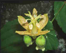
タマガワホトトギス (8月)