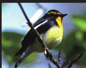
キビタキ /13cm/ 夏