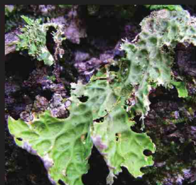
↓センシゴケ。体に丸い穴が多数あいている。

森の中の光と水分条件の変化や空気のごとれに敏感な地衣植物の数は、その地域の気候の特徴や、空気の清浄さを知る指標となります。*解説板⑦参照