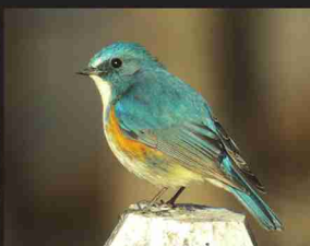
ルリビタキ /14cm/ 冬