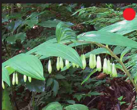
オオナルコユリ (6-7月)