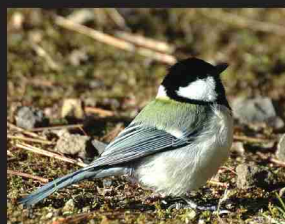
シジュウカラ /14cm/ 通年