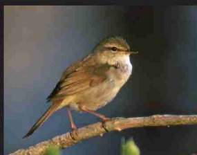
ウグイス /15cm/ 通年