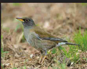
シロハラ /25cm/ 冬