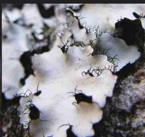
↑マツゲゴケのなかま。体のへりに黒い毛のようなものがはえている。