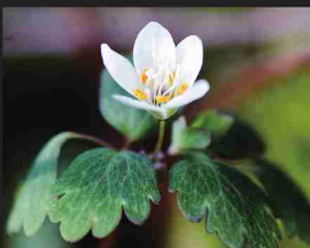
トウゴクサバナノオ (4-5月)