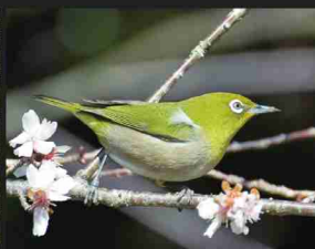
メジロ /12cm/ 通年