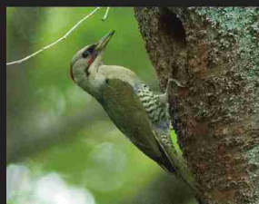
アオゲラ /30cm/ 通年

自然研究路とその周辺では、年間50種類ほどの野鳥を観察することができます。森の中で野鳥を見つけるには、鳴き声や、餌をさがして動き回る音に耳をすませ、音のする方向を目で探すのがコツです。