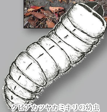
クビアカツヤカミキリの幼虫