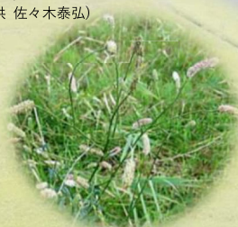
ナガボノシロワレモコウ