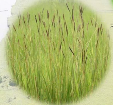
カモノハシ