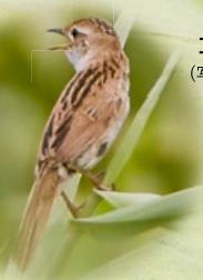
オオセッカ

文化的な側面としては、今では見かけることの少なくなった、かやぶき屋根の材料となる良質な茅の採取地である「茅場」となっており、ここで採取される茅は「しまがや」と呼ばれるブランド品となっています。以前は、毎冬、良質な茅を得るためのヨシ焼き（火入れ）が行われていました。また、管理の一環として、水資源機構により野鳥観察小屋や湿生植物を観察できる木道が整備されており、バードウォッチングの人気スポットにもなっています。