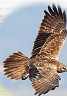
チュウヒ