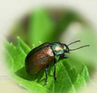
オオルリハムシ