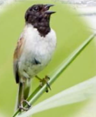
コジュリン