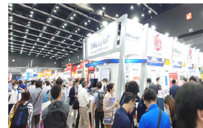
▲アジア最大級の金属加工展示会「METALEX」