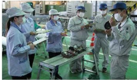
新入社員現場実習風景